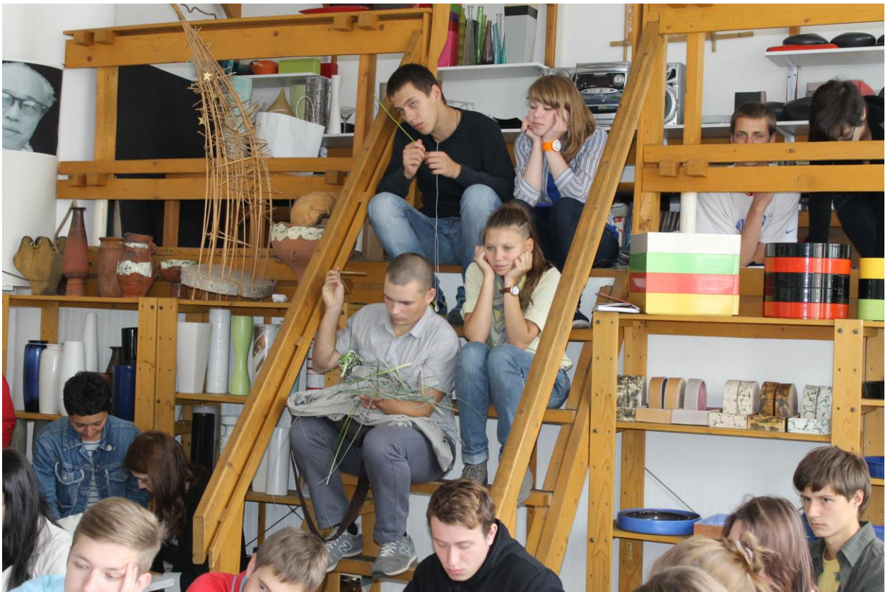
Студенты МАРХИ, МГУЛ, РУДН.