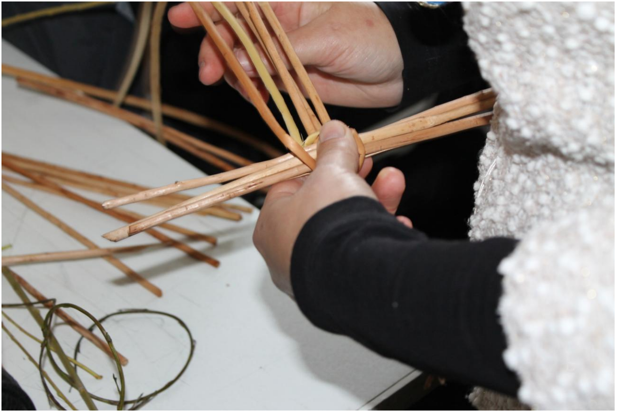
Основные приемы плетения. Дно корзинки.